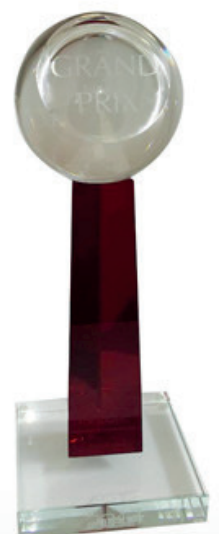
FOR INDUSTRY 2014